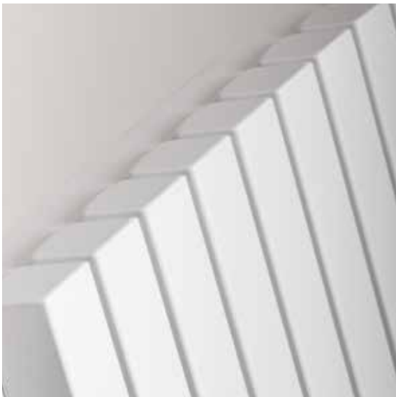
TETRA blanco tráfico 333

El Tetra de Jaga une una serie de sobrios elementos de calefacción juntos en un rotundo radiador. Juntos tienen una sorprendentemente alta emisión de calor. Calidad y solidez Jaga con un toque de gracia.